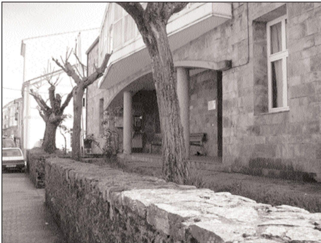
O albergue de Melide acolleu durante o mes de marzo a 873 peregrinos

Estas cifras, sen embargo, nada teñen que ver coas do pasado ano 2004, Ano Santo Compostelano. No mes de abril dese ano, dentro do que se encadrou