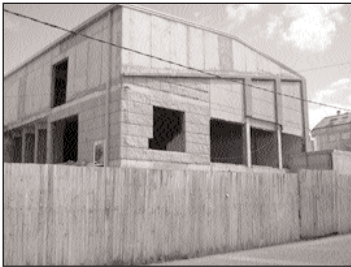
A obra supón un investimento total de 1 millón de euros

A remodelación da antiga Casa da Cultura comezaba