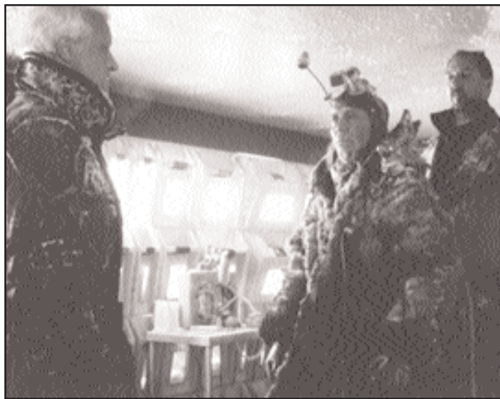
Blade Runner abre o ciclo o venres 15 de abril

O venres seguinte, 22 de abril, proxéctase Touro Salvaxe, do sempre polémico director estadounidense Martin Scorsese. A historia dun boxeador con complexos psicolóxicos e sexuais que o levan a manifestar a súa agresivi-