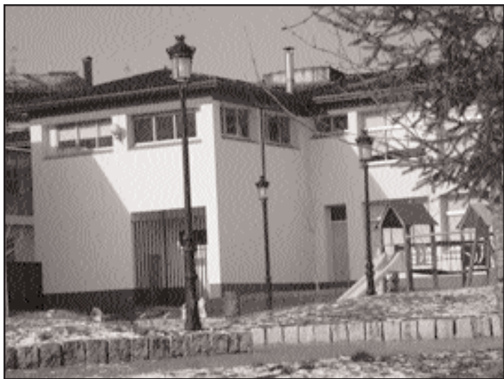
A biblioteca, no Edificio Multiusos, xa ten mascota

O concurso culminará cunha festa o próximo 16 de maio