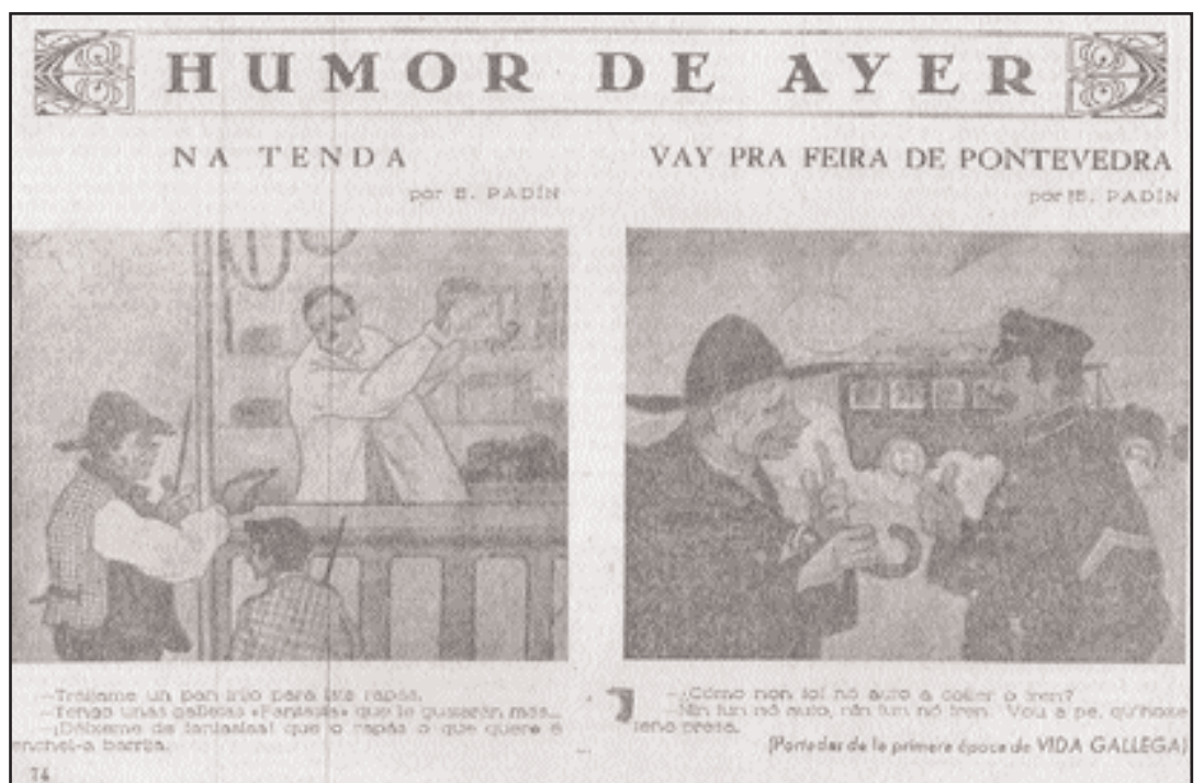
Viñetas de E. Padín, nas portadas da primeira época do xornal Vida Gallega (agosto de 1958).