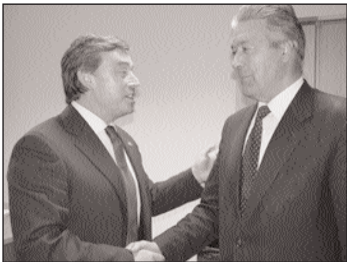
O alcalde solicitou unha partida de 119.000 euros

O alcalde de Santiso afirma que o conselleiro de Medio Ambiente amosouse disposto a acometer a obra