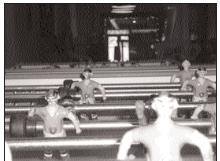
Uns dos fútbolíns do espazo de xogos