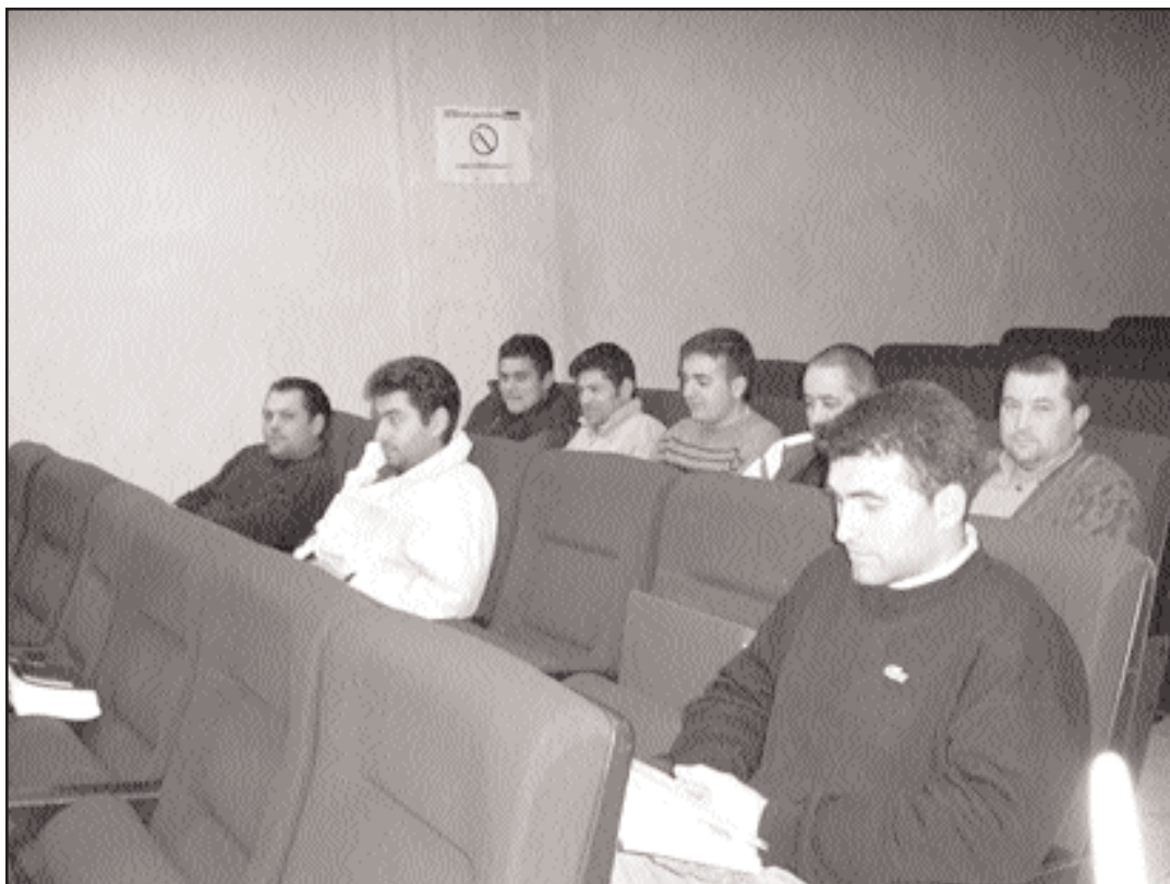
Alumnos de Prevención de Riscos Laborais

Ademais, durante os últimos días de clase, os alumnos van ter a oportunidade de realizaren unha campaña de marketing; un exercicio práctico completo, co seu correspondente estudo de mercado, execución e exposición do mesmo.