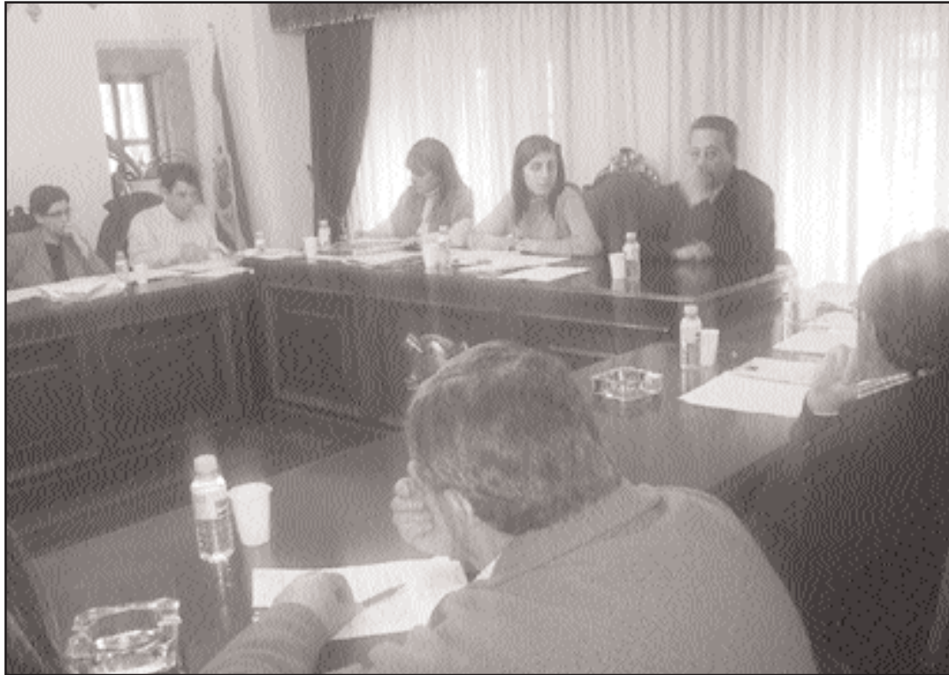
O pleno extraordinario de orzamentos tivo lugar o pasado 21 de marzo

706.089 euros do orzamento de 2005 van destinados á realización de investimentos no municipio. En total, un 13,97% do total, a cantidade máis baixa dos últimos cinco anos. Desta cifra, as arcas municipais achegan con fondos propios 305.500 euros, que se van investir na compra de terreos para a instalación da nova depuradora, reparacións e mantemento do Concello, en investimentos en edificios e na compra dunha furgoneta, así como na segunda fase de construción do Centro Sociocultural comezado o ano pasado. O resto corresponde á Deputación Provincial dentro da partida para o Plan de Obras e Servizos (POS), destinada