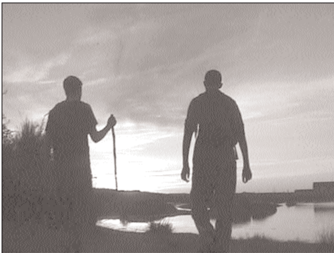
O obxectivo da financiación e preservar as características naturais da ruta

nual da Xunta de Galicia, que comezou en 1998, e que ten vixencia, polo momento, ata 2009. Neste periodo están previstas 37 actuacións ao longo de once Concellos da ruta francesa, co obxectivo, segundo a Consellería, de “preservar a arquitectura tradicional que se conserva e potenciala, mantendo o carácter e identidade do Camiño de Santiago”.