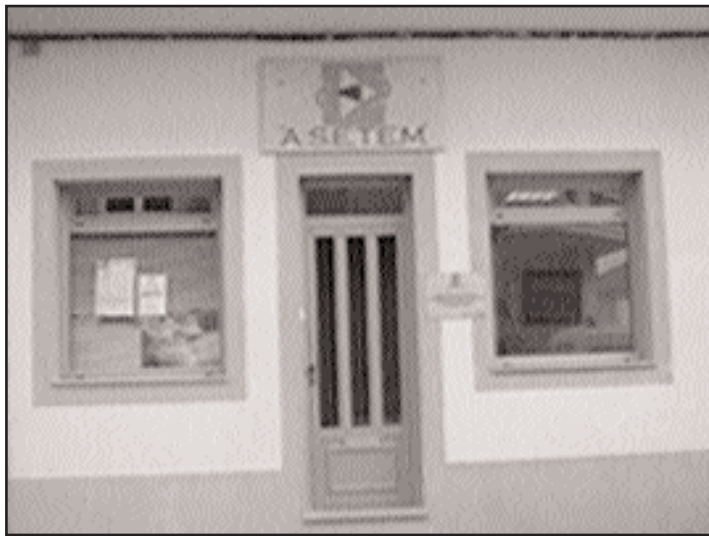
Tras varias reunións, a directiva optou pola anulación

Os problemas comezaron cando a Asociación orga-