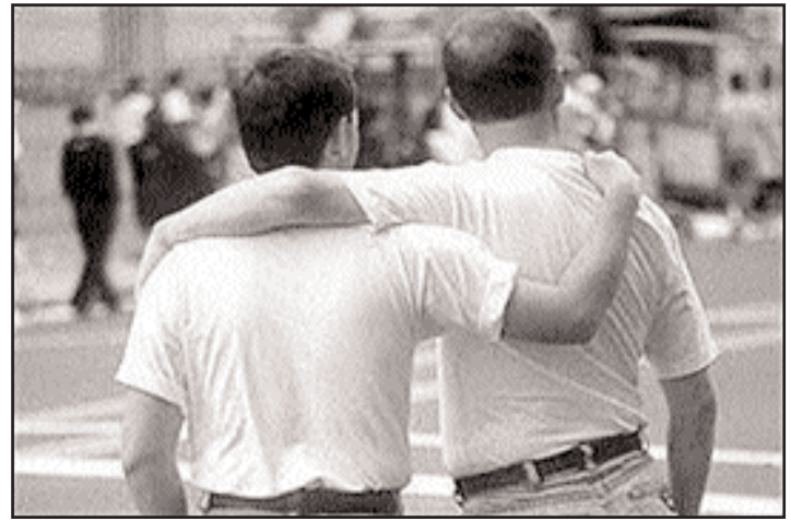
Imaxes como ésta son aínda pouco comúns en Melide

No regulamento aprobado polo pleno establécese expresamente que “con independencia da súa orientación sexual” todas as parellas que cumpran unha serie de requisitos formais e que vivan en Melide poden inscribirse neste Rexistro Municipal. As vantaxes para quenes decidan dar este paso están no ámbito competencial municipal. É dicir, para calquera xestión no Concello de Melide, as parellas inscritas “terán a mesma consideración xurídica e administrativa que as unións matrimoniais”. Ademais, este Rexistro non terá carácter público.