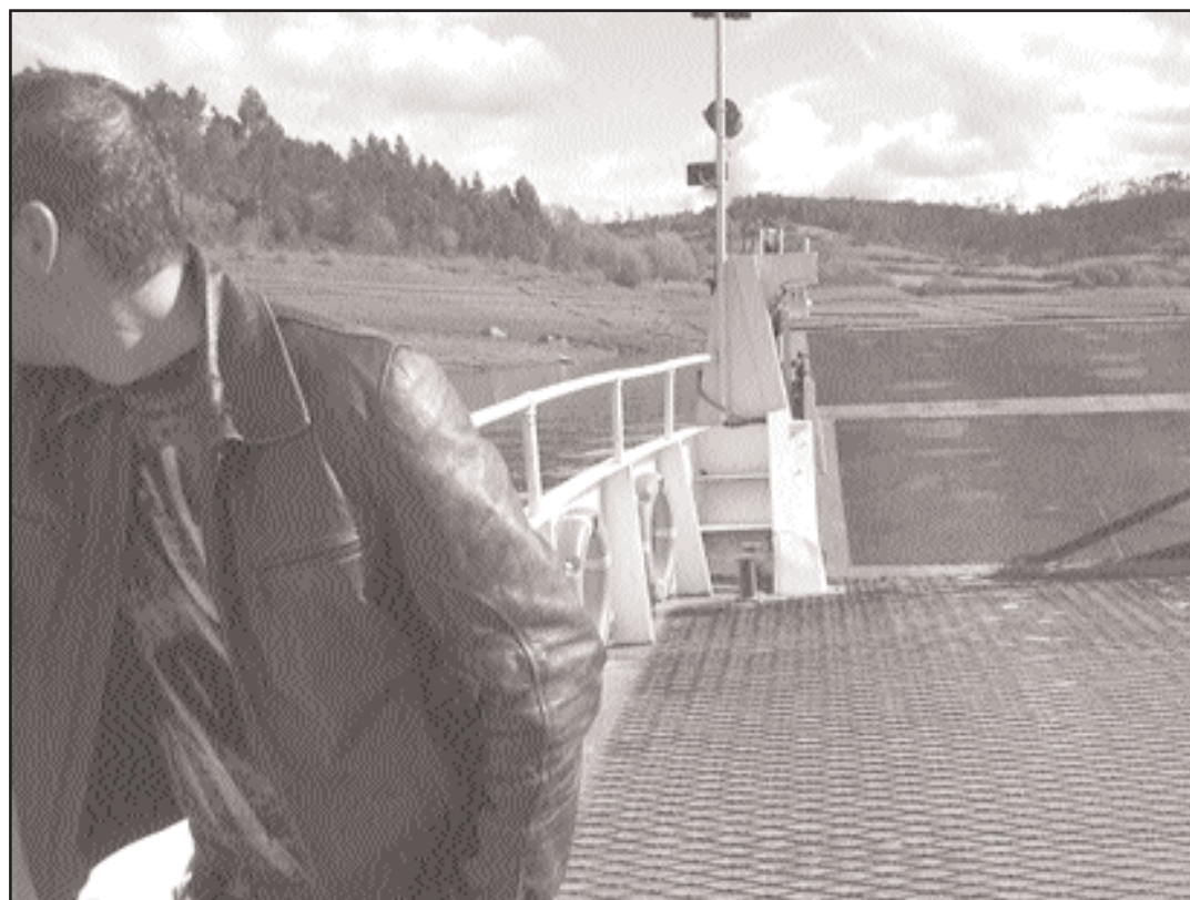
O barco navega continuamente sobre a enorme lagoa artificial creada pola presa

empresa eléctrica a cumprir a citada condición número 18.