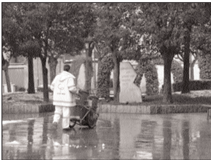
Un empregado de Celta Prix no Cantón de San Roque

A este respecto, solicitan desde o órgano sindical que "os alcaldes afectados esixan a aplicación da sen-