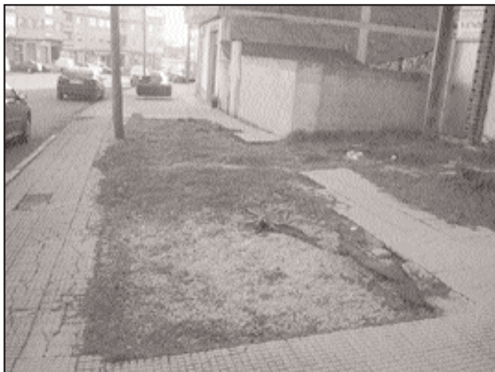
Estado actual dun tramo das beirarrúas da Codeseira