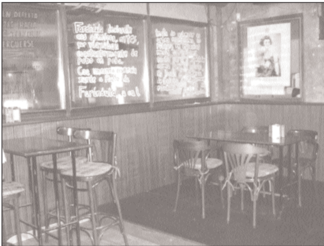
A zona da cervexería con frases nos cristais, escritas polos clientes

Especialistas en infusións e en café de importación, o ambiente diurno de cafetería pretende satisfacer os clientes máis esixentes. O mesmo ocorre coa cervexería, única en Melide na que poderemos beber cervexa Estrella Galicia de bodega.