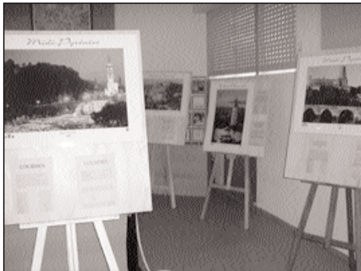
Por Aveyron pasan camiñantes procedentes de Suíza

A mostra estivo no Edificio Multiusos da vila durante tres días, tralos que volveu a Francia cos