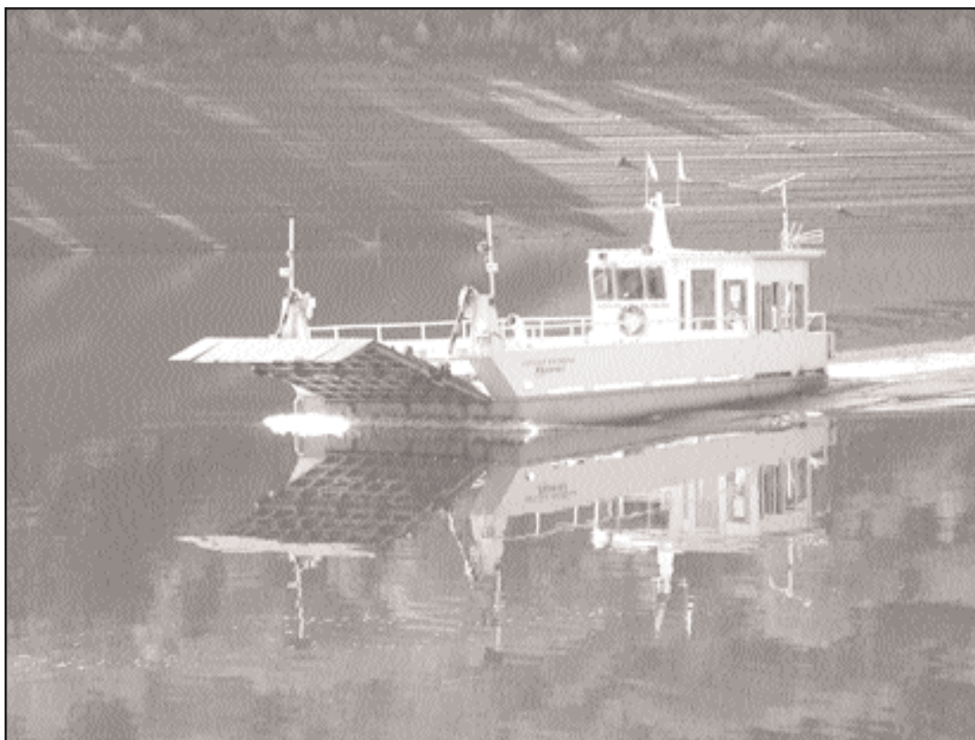
O barco está dispoñible as 24 horas e custodiado sempre por dous barqueiros

Unha vez tiveron todos os datos precisos na man, entre os que estaba a normativa ministerial de 1975 que establece que o barco debe ter unha capacidade de carga de 15 toneladas métricas e permitir así o paso de “vehículos, carros, persoas e animais”, decidiron acudir á delegación de Fenosa en Ourense para expor o seu problema e buscar alí solucións. Sen embargo, o proceso non foi fácil.