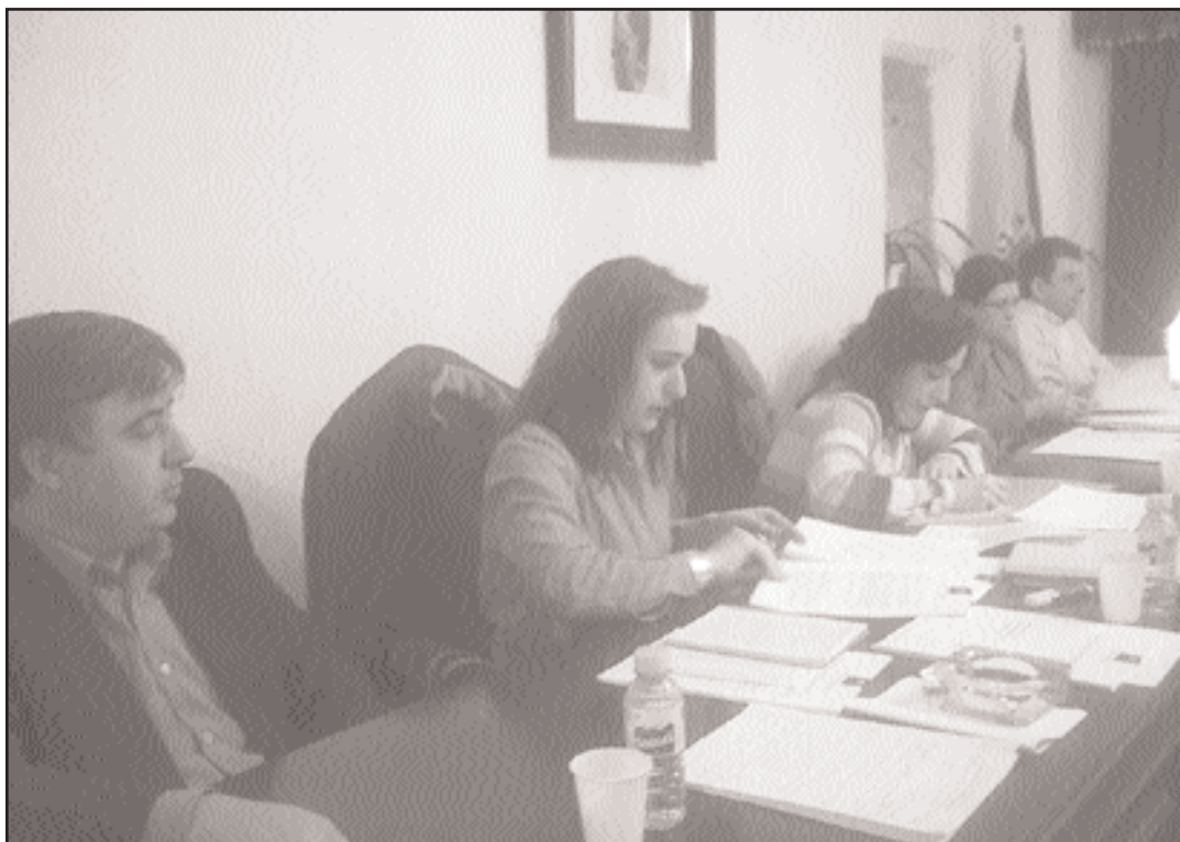
Os concelleiros da oposición votaron en contra dos orzamentos para 2005

A voceira nacionalista, Soqui Cea, explica esta apreciación con datos do orzamento de 2004: se os traballadores da Escola