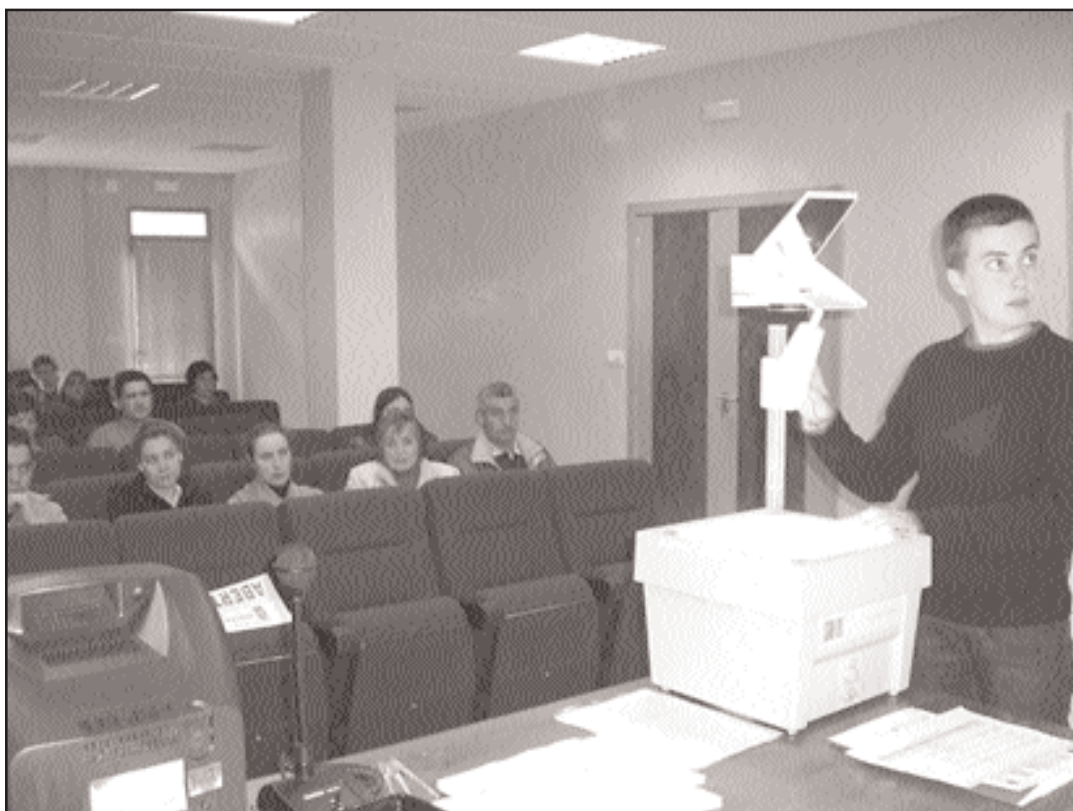
O último cursiño tivo lugar o pasado 4 de abril

imparte un cursiño de catro horas para a obtención deste documento. O próximo será o 4 de xullo.