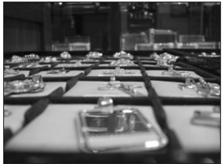
Algunhas pezas de ouro de Oro Ley