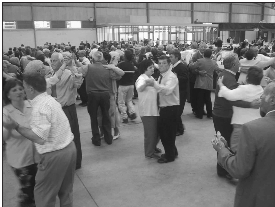
Os maiores de Melide durante o concurso de baile no Pazo de Congressos

do goberno e a oposición presidiron as mesas do Pavillón Polideportivo de Sobrado dos Monxes, ao que acudiron 460 persoas para degustar un menú un tanto distinto aos demais,