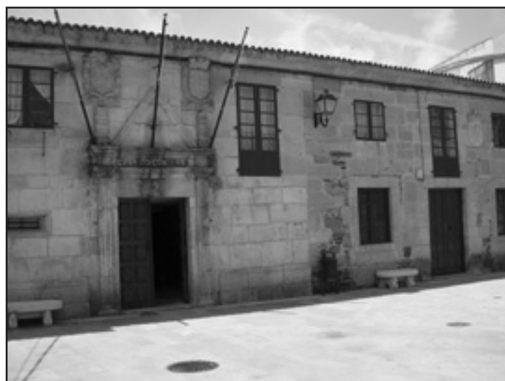
A demora nos pagamentos varía entre tres e trece meses

Anteriormente, a entidade demandante presentara unha reclamación administrativa no Concello de Melide solicitando o pago dos intereses correspondentes á demora no pago de varias obras para as que fora contratada. O traballo realizouse en varias fases entre os anos 1.999 e 2.001, e a tardanza nos correspondentes pagos