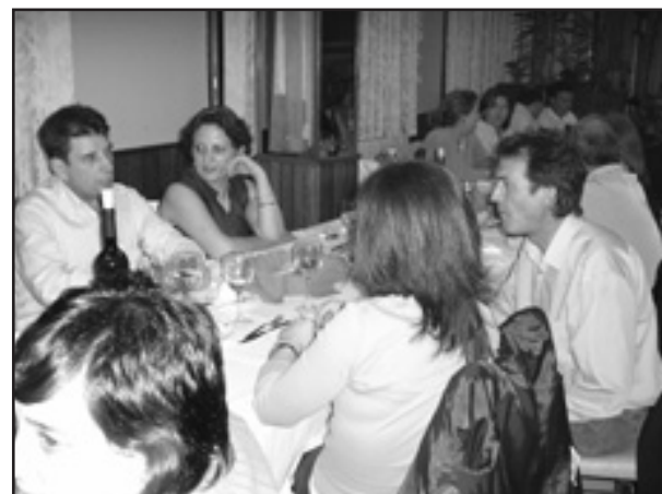
Membros da Xunta Directiva de ASETEM, representantes de corporacións municipais e do sindicato UXT compartiron mesas na cea