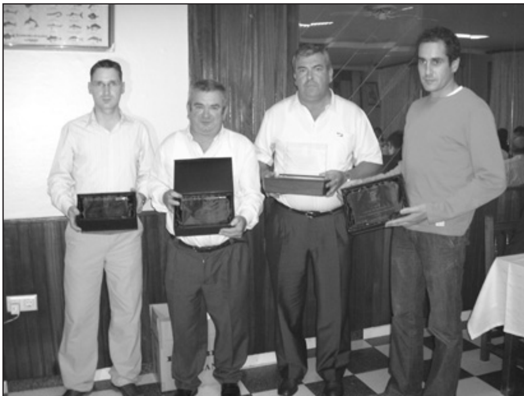
De esquerda a dereita: representante de Supermercados García, Construcciones Pambre, Lácteos Terra de Melide e Canteras de Richinol