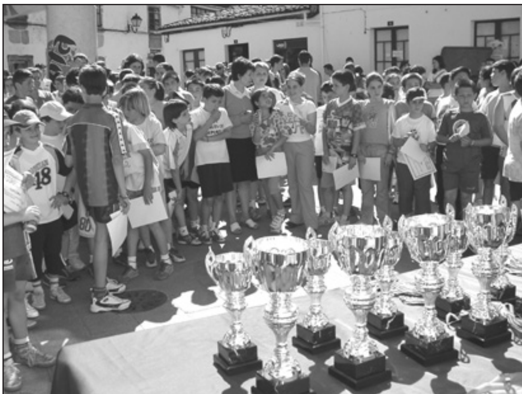
Diplomas para todos e trofeos para os mellor clasificados de cada carreira

Todos os participantes nesta quinta edición de Corremelide, alumnos dos colexios nº1 e nº2 así coma do IES, dividíronse en categorías por idade e sexo e mediron as súas forzas en dez carreiras polo casco antigo de Melide. Mentres, na Praza do Convento agardaban os demais a súa quenda xogando á comba, a rá, ao aro, ou a outros xogos tradicionais. Ao final de cada carreira, os gañadores recollían os seus trofeos e daban paso á seguinte. Ao remate da mañá, leuse un manifesto en favor da lingua galega.