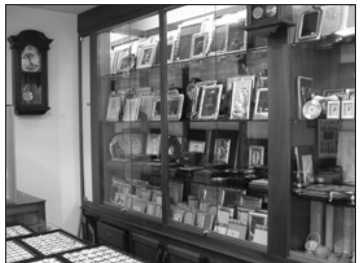
No interior de Oro Ley atopamos todo tipo de pezas