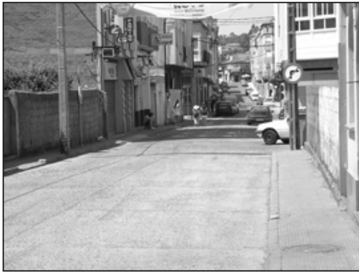
A rúa Galicia será unha das afectadas polas obras

Pola súa parte, o Concello de Melide comprométese