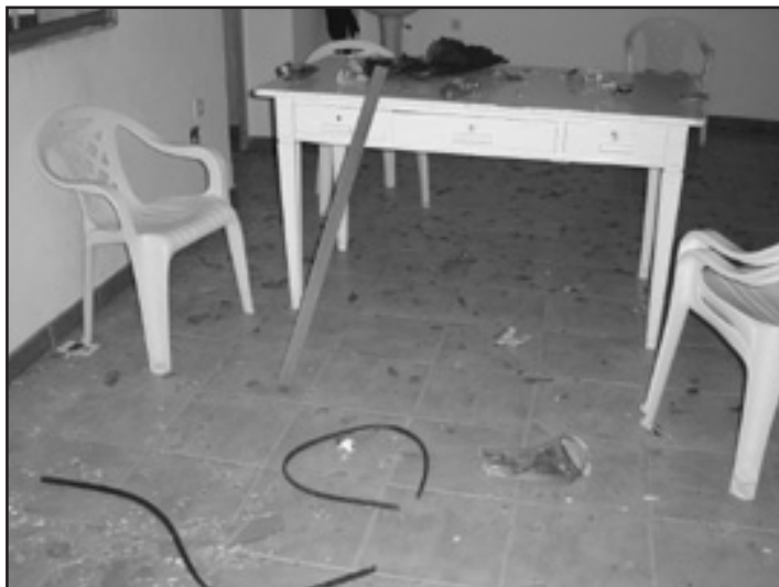
Imaxe dunha das dependencias do local

Ademais, os nacionalistas acusan ao goberno local de "discriminación con respecto a outras parroquias", xa que consideran que esta instalación é a máis abandonada e sucia