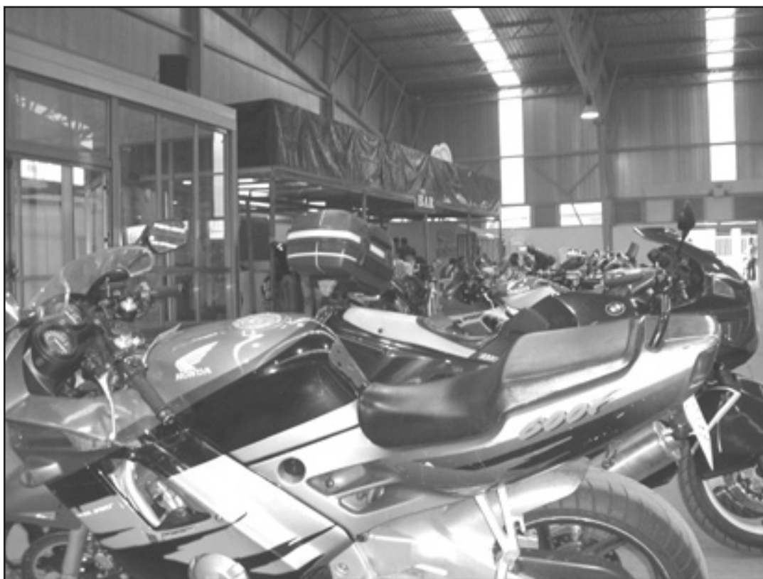
O Pazo de Congressos converteuse nunha exposición de motos de estrada

Nesta segunda edición, afeccionados e afeccionadas aos “cabalos de aceiro” xuntáronse no Pazo de Congressos e Exposicións desde o mediodía do sábado. O acto estrela veu da man do portugués Paulo Martinho, que fixo gala da súa habilidade enriba da moto cunha exhibición de acrobacias polas rúas que rodean o recinto. A noite do sábado os moteiros e moteiras compartiron mesa no Pazo de Congressos e, despois, tras un segundo pase das acro-