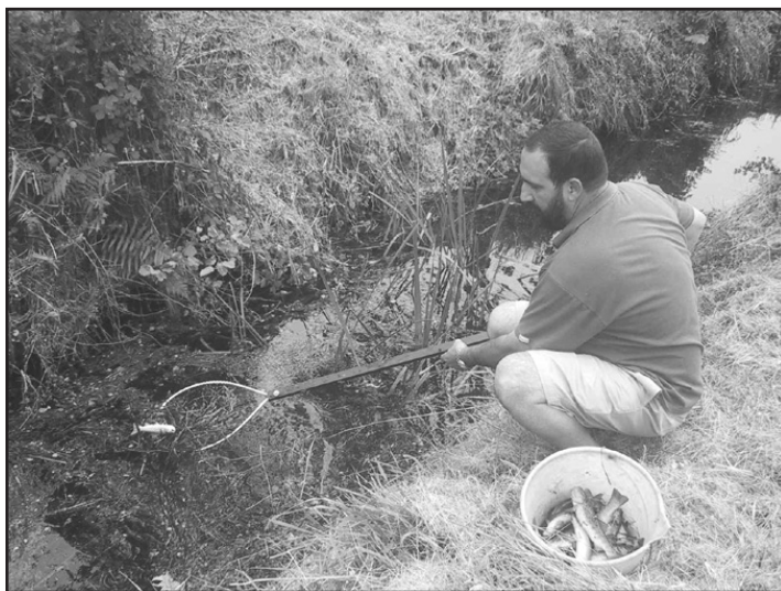
Membros da Asociación recolleron unhas oitenta troitas

Ésta á a tese que sostén a Asociación de Troiteiros para explicar a morte masiva destes peixes pero, a resposta definitiva terémola dentro de aproximadamente un mes, cando SEPRONA teña os resultados da análise da mostra de auga que recolleu na presa. Ademais, este organismo solicitará a información pertinente para averiguar qué persoas fixeron a limpeza da canle, se tiñan os permisos