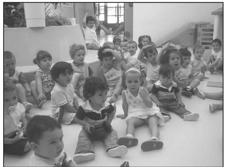
Actualmente hai sitio para 59 nenos de ata 3 anos

A día de hoxe, a gardeiría municipal conta con 59 prazas, das que anualmente se ofertan só algunhas, xa que outras quedan reservadas para os nenos