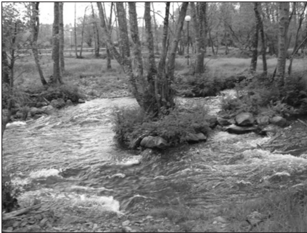
Cauce do río Ulla na Área Recreativa de A Cornella