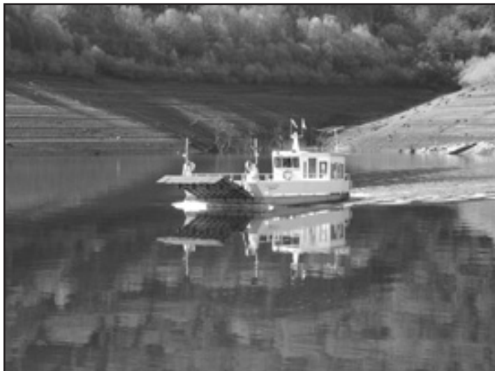
Imaxe da barca facendo a ruta Loño-Beigondo

pla un aumento do ancho da barca (actualmente de 5 metros) para que sexa “suficiente para virar un carro do país coa súa xogada”, tal e como obriga a Orde Ministerial do ano 1975, reguladora desta infraestrutura. Ademais, propoñen á Consellería que a barca teña unha saída na mesma dirección de entrada, que evitaría a dificultade de ter que facer saír aos animais marcha