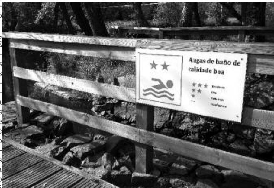
A Xunta obriga a informar aos bañistas sobre a calidade das augas