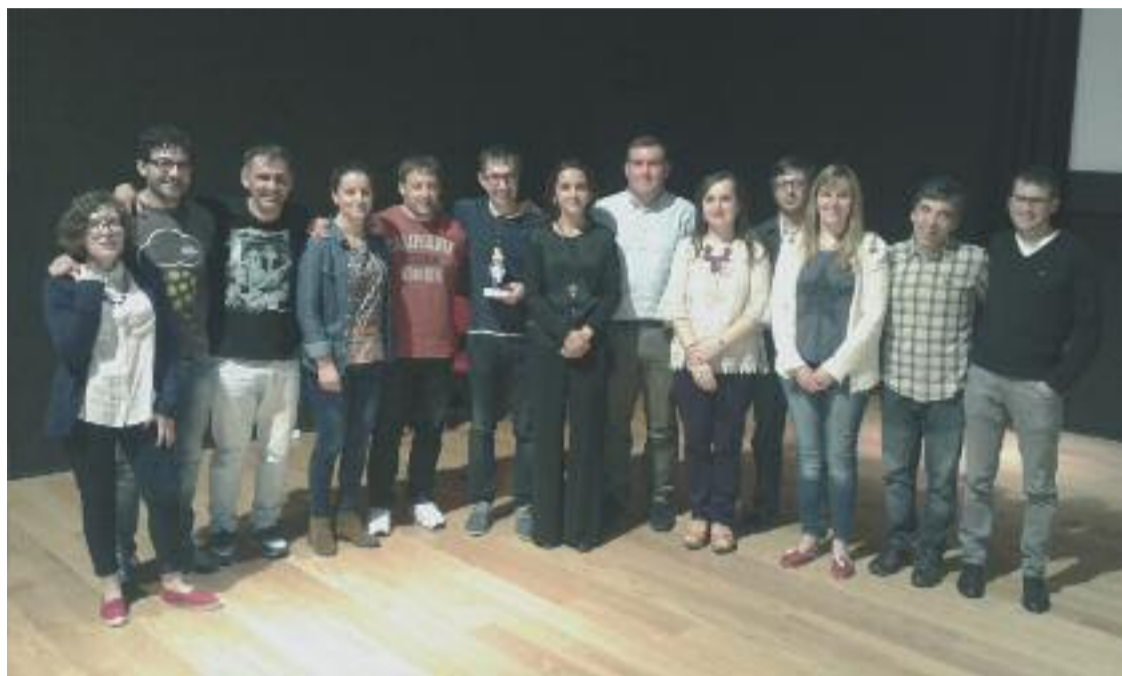
A directiva de O Noso Lar, alcaldes da comarca e representantes do SNL na entrega do premio

O Servizo de Normalización Lingüística (SNL) da Terra de Melide entregou, como vén sendo habitual nos últimos cinco anos cada mes de xuño, o Premio á Defensa do Idioma, co que se pretende recoñecer o traballo de organismos, entidades e persoas que contribúen a normalizar o uso do galego en diferentes ámbitos.