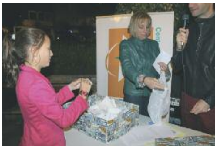
Sorteo de premios na edición de 2015

Os regalos que se sortearán son cinco vales de 50 euros, dou vales de 25 euros, dúas gafas de sol, un conxunto de bolso e carteira, unha camiseta de señora, un casco de motorista, un tensiómetro, tres mochilas, unha manta infantil, dous pixamas, unha gravadora de voz, un reloxo para señora ou cabaleiro e un neceser con produtos cosméticos. Ademais, por cortesía do Hotel-Balneario Río Pambre, situado na localidade veciña de Palas de Rei, tamén se sor-