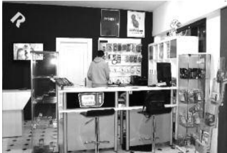
Hardgalicia, distribuidor de “R”, está na Rúa do Convento nº 6

Os establecementos de Asetem que se fagan clientes de R e contraten dito combo