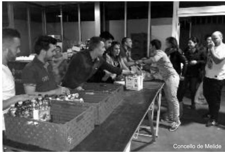
A organización recolle alimentos á entrada do concerto solidario

Rematada con éxito a gala, agora é cando comeza o traballo desa outra parte implicada neste proxecto solidario: Cáritas parroquial de Melide, que será a entidade encargada de repartir a metade dos alimen-