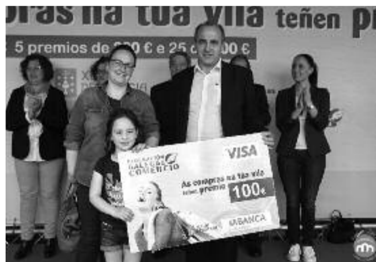
Unha cliente premiada recibe un vale de 100 euros