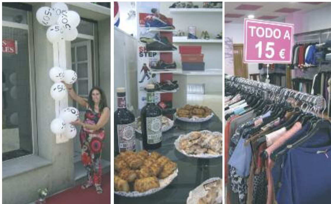
Decoración especial, petiscos e prezos reducidos son os principais atractivos da Noite Aberta

Vinte e nove tendas asociadas a Asetem abrirán ata as 00:00 horas con descontos que chegarán ao 60%