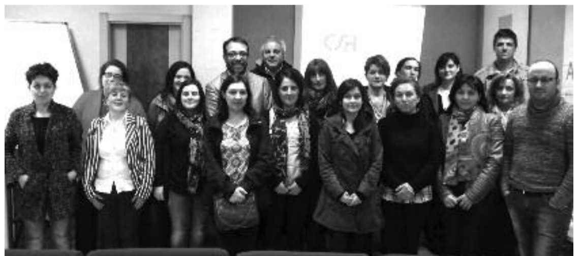
Alumnado da xornada formativa impartida en Asetem polo Centro Superior de Hostalería de Galicia

O salón de actos de Asetem acolleu unha xornada formativa organizada pola Escola de Turismo Itinerante do Centro Superior de Hostalería de Galicia na que unha vintena de profesionais de albergues do Camiño aprenderon conceptos clave sobre o uso das redes sociais como instrumento para promocionar o negocio.