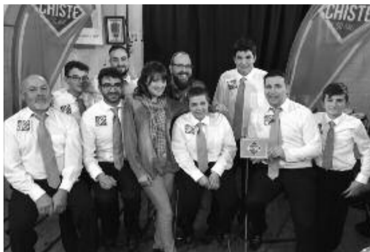
Membros da banda durante a gravación do programa

Un equipo de Pórtico Audiovisuales, a empresa produtora do programa, desprazouse o 13 de maio ata Santiso