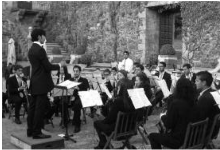
A banda de Visantoña en 2014 no concerto do Día do Socio

Así é a última iniciativa posta en marcha pola Asociación Cultural Banda-Escola de Música de Visantoña, que baixo o lema Leva a Banda a onde ti queiras sortea un concerto de 45 minutos a realizar en calquera punto da xeografía galega. O privilexio de ter á súa disposición unha das agrupacións musicais máis antigas de Galicia terao o portador ou portadora da papeleta cuxo número coincida coas tres últimas cifras do primeiro premio da Lotería Nacional do Neno, sorteo que se celebrará o 6 de xaneiro de 2017. As rifas xa están á venda no Mesón Visantoña e no Bar Lareira. En Melide pódense atopar nos restaurantes Ribeira Sacra e Toxo.