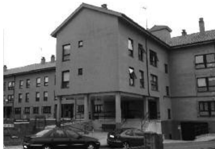
As vivendas teñen deficiencias nas cubertas e nas fachadas

As protestas de 20 familias residentes nos pisos de protección oficial da segunda fase pola progresiva deterioración das súas vivendas tan só 8 anos despois de seren construídas comezan a dar os seus froitos. A Consellería de Infraestruturas, a través do Instituto Galego da Vivenda e do Solo (IGVS), anunciou que investirá 13.000 euros na súa mellora.