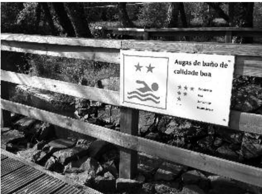
A Xunta obriga a informar aos bañistas sobre a calidade das augas

tancias que de non ser o caso discorrerían con normalidade polo leito do río evitando a sobrecarga de residuos que podían danar a calidade da auga da zona de baño. A Alcaldesa instou ás autoridades competentes a que estas analíticas se realicen nun período de tempo moito máis reducido co fin de poder controlar e ao mesmo tempo coñecer cales son as causas ambientais que poden ser determinantes para dita calificación. Dende Sanidade, así como outros departamentos da Administración autonómica teñen xa recabado información suficiente sobre todas as construcións que se encontran preto do cauce do Río Furelos na zona de baño así como outras actividades que afectan a conca.