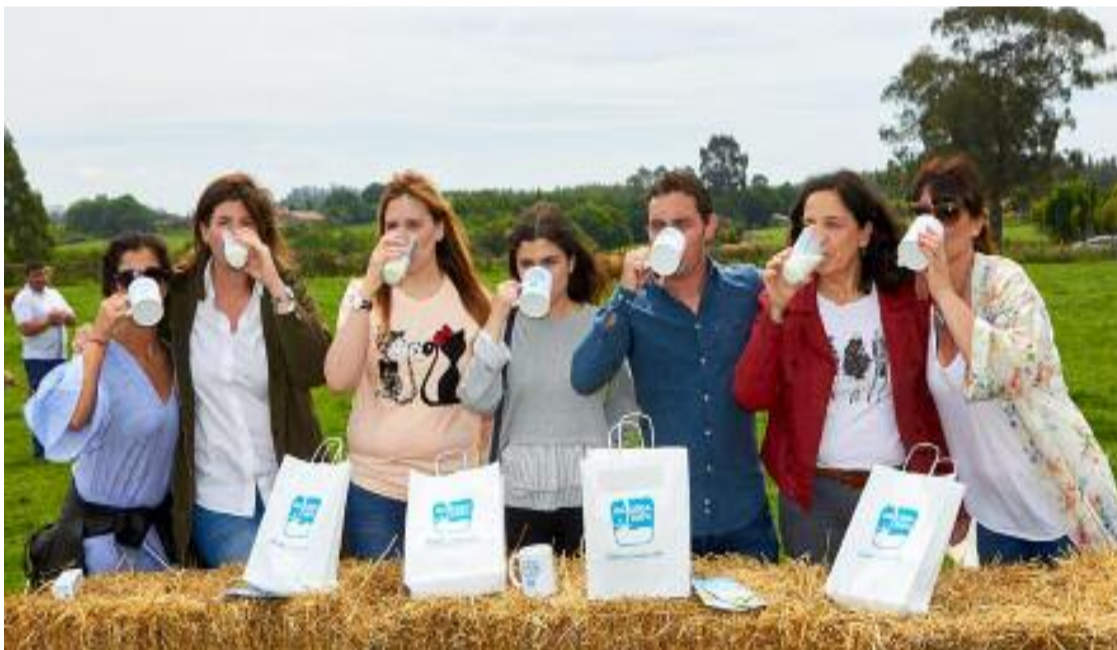
Presentación do programa “ruralizarte” en Orois (Melide)

Buscase unha nova xeración de artistas galegos! , así o presentarán en Orois (Melide) nun paraxe único e nunha roda de prensa tamén única como describía Rubén Riós, “que mellor que respirar o aire das nosas aldeas”.