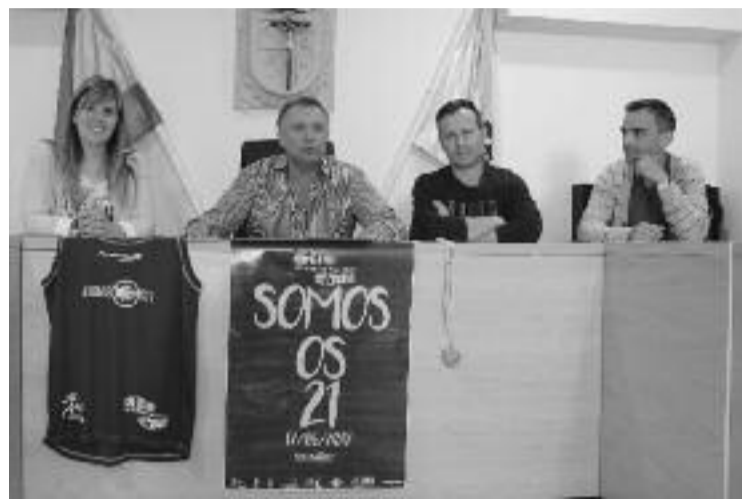
Roda de prensa os 21 no camiño

A excelencia na organización e a singularidade e beleza