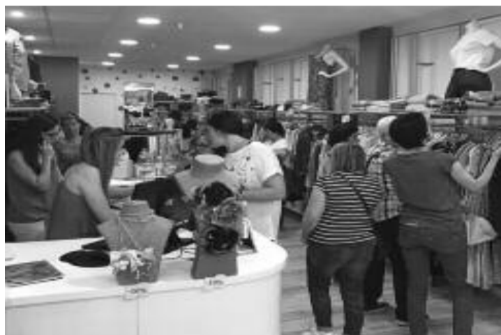
Establecemento de Ekate

Máis de 400 profesionais poderán mellorar a imaxe das súas tendas e gañar competitividade