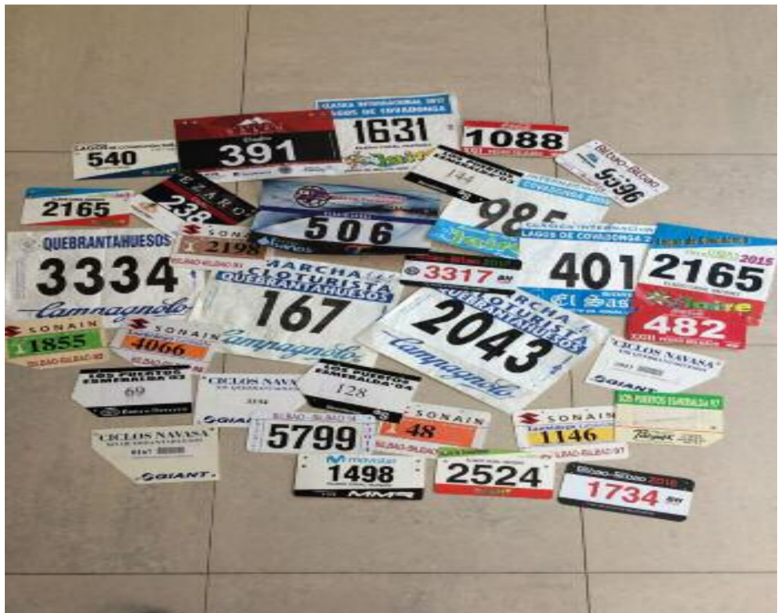
Dorsais das probas nas que participaron na súa longa traxectoria