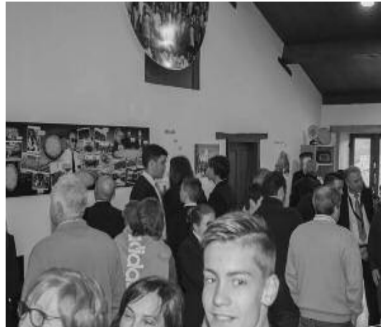
Exposición da banda de Visantoña no seu 140 aniversario

música camiña a Asociación Cultural Banda Escola de Música de Visantoña, a cal nace no ano 1990 coa finalidade de garantir a continuidade da Banda de Música de Visantoña e que se configura como a titular da mencionada Escola de Música Eugenio Pazos Reyes, escola que conta desde o ano 1998 co recoñecemento como Escola de Música dependente da Consellería de Educación e Ordenación Universitaria. O obxectivo da devandita escola é mellorar a educación musical e os valores culturais, e implantar unha sólida formación de base que permita o fortalecemento dos primeiros pasos no mundo da música, e para iso desenvolve unha oferta ampla e diversificada de educación musical, sen límite de idade, con clases continuas durante seis días á semana no local de ensaios de Visantoña, neste ínter conta con 40 alumnos e alumnas da contorna e outros concellos limítrofes.