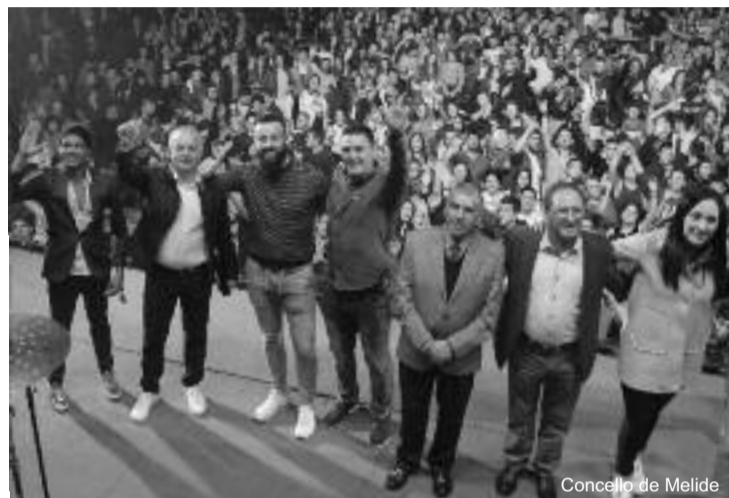
Membros da organización da Gala Solidaria

Rematada con éxito a gala, agora é cando comeza o traballo desa outra parte implicada neste proxecto solidario: Cáritas parroquial de Melide, que será a entidade encargada de repartir a metade dos alimentos recollidos entre aproxima-