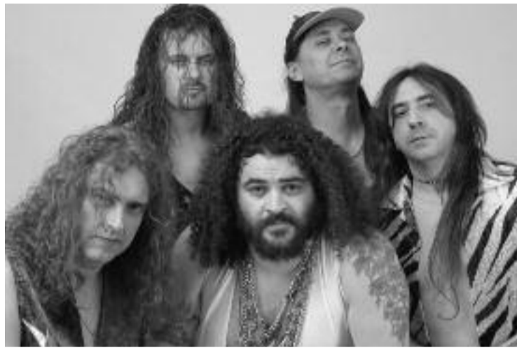
Mojinis Escozios concerto da 5ª concentración moteira