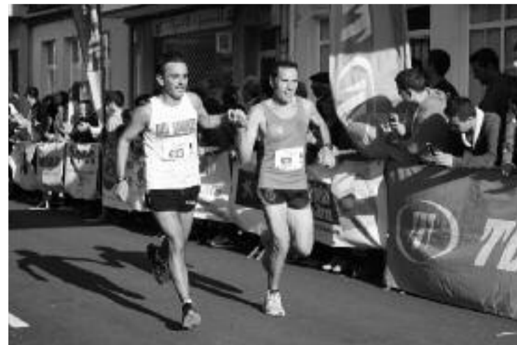
A deportividade, sempre presente na media maratón