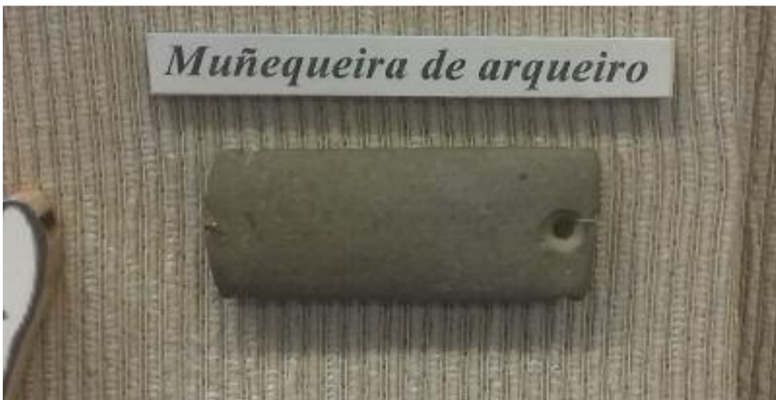
Muñequeira de arqueiro procedente do Castro Codesal Concello de Toques

Por segunda vez o Museo de Melide bota man dunha peza arqueolóxica procedente do Castro do Codesal (Lugar dos Curros, parroquia de Santa María da Capela, Concello de Toques