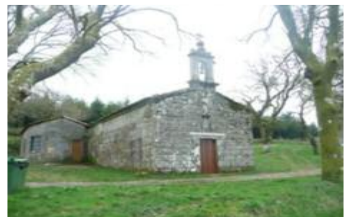
Exterior do Santuario das Pías

Tamén é moi destacado o ritual que se fai en torno ó carballo centenario ubicado no flanco sur da igrexa, de porte moi maxestoso polas grandes dimensións que ten (ó redor duns quince metros de altura e considerable grosor). Este carballo presenta unha cruz gravada na súa codia, feita para sacralizalo e que ademais conta cunha pía ós seus pes. A tradición manda encher dita pía con auga da Fonte Santa (que ademais foi bendicida), e dar nove voltas ó redor do carballo e da pía, dándolle un bico ó tronco en cada volta para obter a curación dos males da reuma.