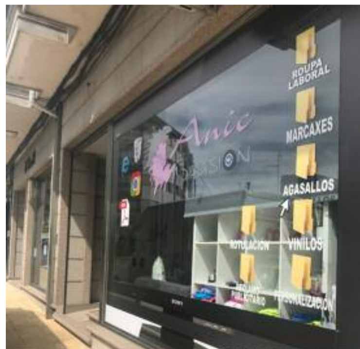
Orixinal deseño do escaparate de Anic Difusión