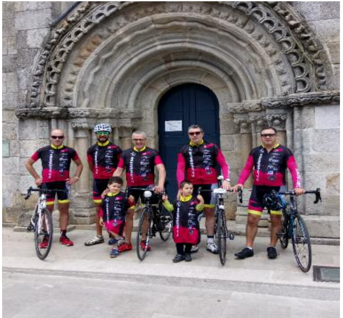
Os membros que forman o C.C Melidense cos seus cativos lucindo nova equipación

Está e a mensaxe dun club modesto que quere seguir a rodar outros 25 anos máis . Por iso pedimos comprensión e respeto na estrada , xa que somos a parte máis fráxil, non máis atopelos , non mais vagoas , gracias.