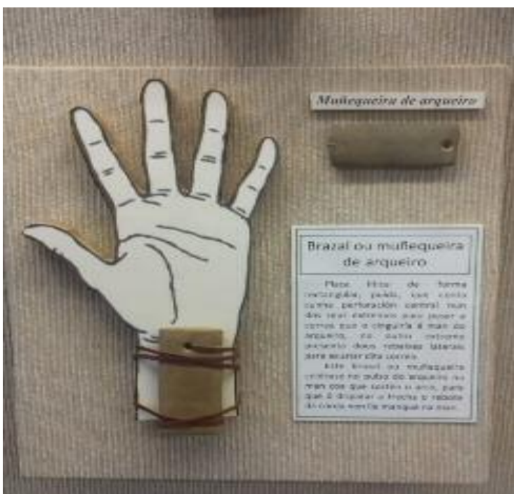
Así se utilizaba a Muñequeira de arqueiro

Nesta ocasión amosamos unha peza de pequeno tamaño pero relevante, posto que se trata dun tipo de obxecto do que non hai demasiados exemplos expostos noutros museos de Galicia. Estamos a referirnos a un brazal de arqueiro, datado na Idade do Ferro (Cultura Castrexa, que se desenvolve groso modo entre os séculos VIII a.C. e o II-III d.C.).