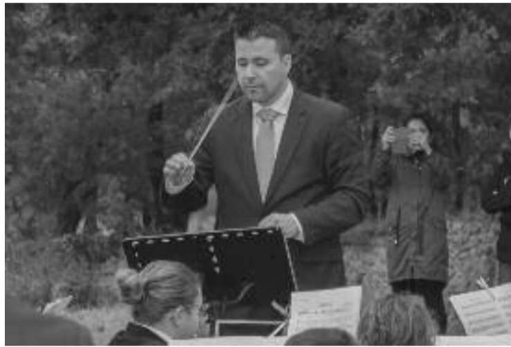
A banda de Visantoña no seu 140 aniversario