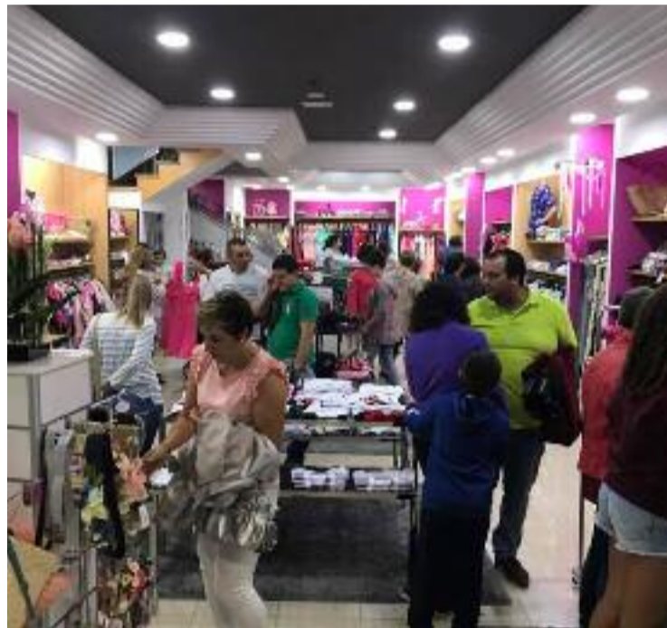
Así lucían os establecementos participantes na Noite Aberta