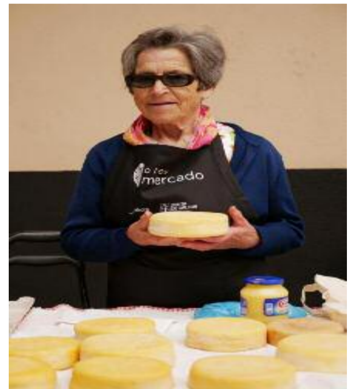
Campana "Quere o teu mercado" en Melide

Baixo a campaña "Quere o teu mercado" os placeiros sinalan que teñen fortalezas como a "calidade e frescura dos seus produtos", que poden dar unha atención personalizada aos seus clientes e que a rotación nos postos non é tan acusada como noutros sectores. Apostan tamén por engancharse ás oportunidades que se lle poñen no camiño, como incluír nova variedade. O informe DAFO, que se realizou a través de entrevistas persoais cos representantes dos comerciantes "para evitar rumbos", apunta tamén a que hai actualmente ameazas que poñen en perigo a continuidade dos mercados se non se toman decisións que as neutralicen. Os placeiros aseguran que a clientela habitual é de persoas "maiores de 70 anos dentro dunha unidade familiar de poucos individuos e en diminución".