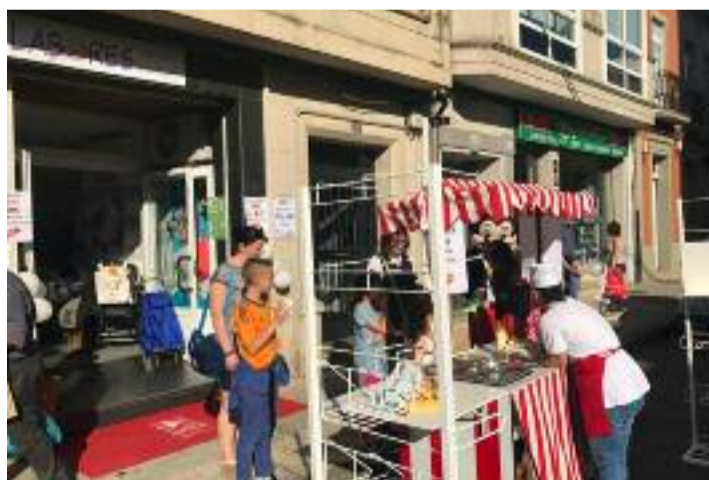
Rúas de Melide durante a Noite Aberta

Milleiros de visitantes de diversos puntos da xeografía Galega, achegaronse ata Melide para realizar as súasdebido os grandes descontos, as rúas cheas de colorido, música e animación conquistaron as miradas de centos de persoas que quixeron desfrutar de unha gran tarde-noite na que acompañou o sol e as elevadas temperaturas.