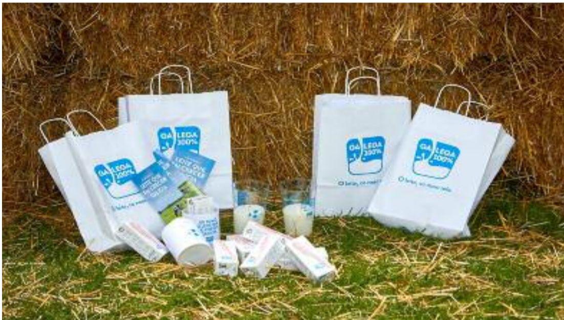
“Ruralizarte” promociona o leite 100% galego