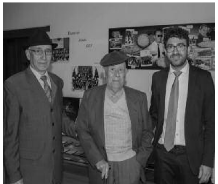
Membros da banda de Visantoña