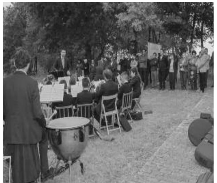
Concerto da banda de Visantoña no seu 140 aniversario