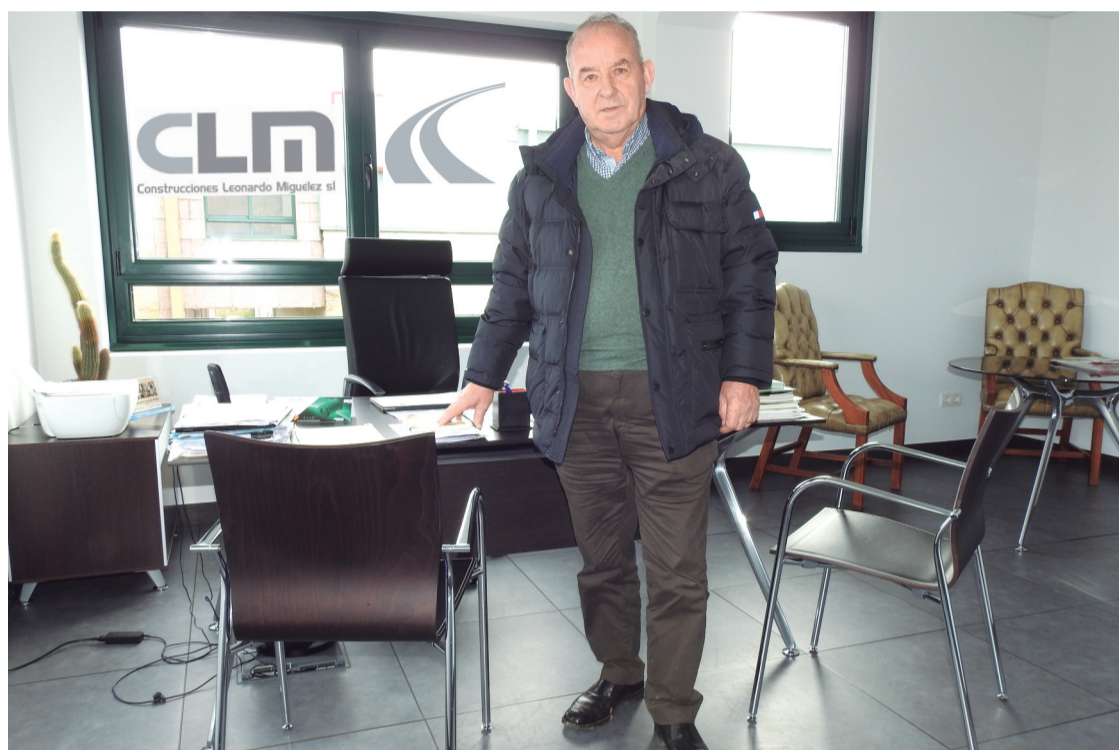
As oficinas de Construcciones Leonardo Miguélez están situadas no polígono industrial de Melide