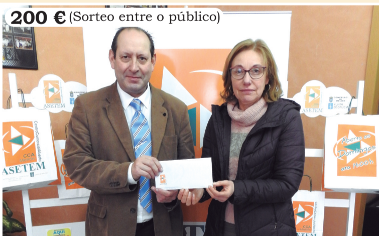
200 € (Sorteo entre o público)