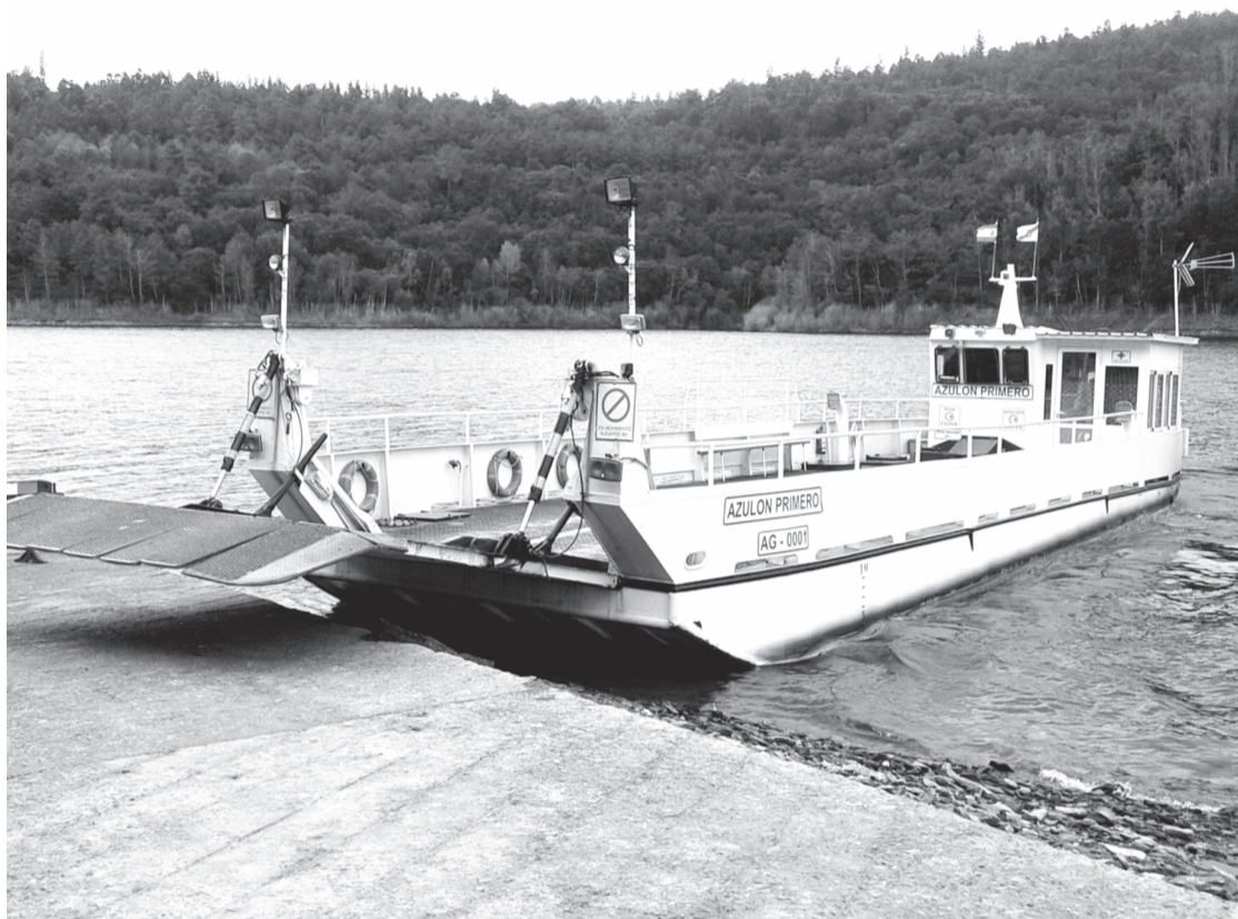
Barcaza que une as parroquias de Loño (Vila de Cruces) e Beigondo (Santiso), dende os anos 70

E non só iso, a obra para a ampliación das ramplas está sen acabar. “Nunha reunión que mantivemos hai tempo no Concello de Vila de Cruces cun representante de Fenosa e outro da Consellería reivindicamos que debería de haber un estudo de enxeñería de camiños para ver exactamente cal debería de ser o ancho da rampla. Nós consideramos que o ancho deben ser 13 metros. Iso non se fixo e decidiron que era